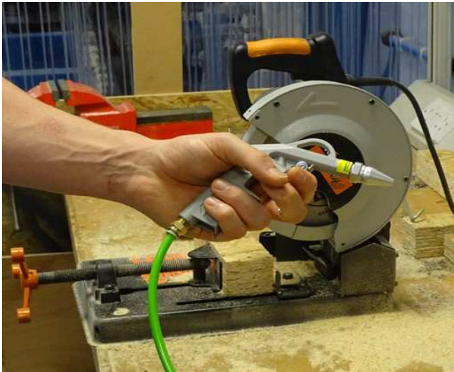
Safety Blowgun používaný pro odfuk nečistot z pracovní plochy.